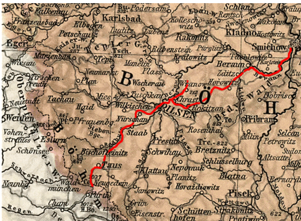
Česká západná dráha

Na mikulovskú dohodu nadviazala 1. augusta 1866 v Brne podpísaná železničná dohoda. Víťazní Prusi si zabezpečili obnovu železničných tratí na okupovaných územiach, opravu rušňov, odstránenie zátarás, obnovu mostov a tunelov. Ich tlak sa prejavoval v rýchllosti vykonávaných prác. Oprava nám známeho mosta pri Mokropsoch trvala iba tri dni.